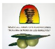
SCA Los Remedios Antequera